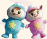
ふわっぴー (富士見市)