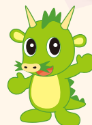
つなが竜又ウ (さいたま市)