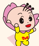
さっちゃん (幸手市)