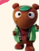
ムジナもん (羽生市)