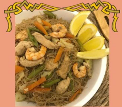
★ ぱんちっとびほん Pancit Bihon (¥600)