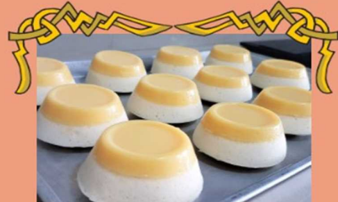
◆ フートフラン Puto Flan (¥600)