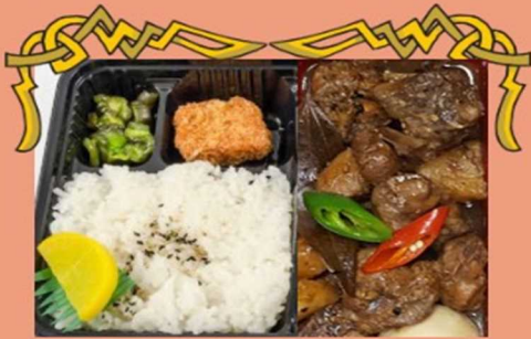
★ チキン アドボ Chicken Adobo (¥600)