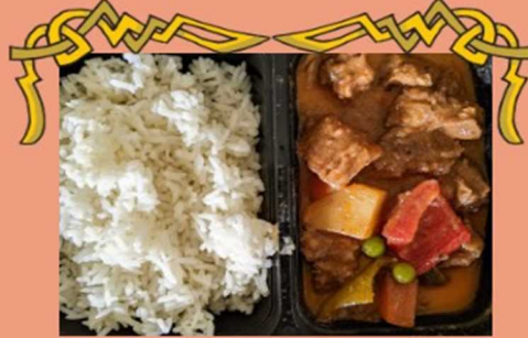
★ ビーフカルデレタ Beef Caldereta (¥800)