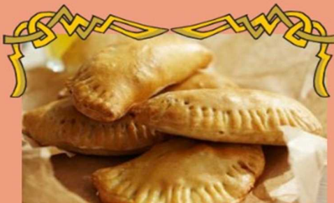
◆ エンパナーダ ハムチーズ Empanada Ham & Cheese (¥600)